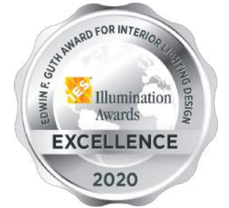
Illumination Awards Excellence 2020