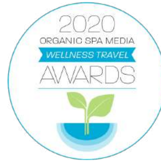
Organic Spa Media- Wellness Travel Awards 2020