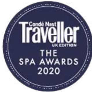
Condé Nast Traveller - The Spa Awards 2020 - Best Fitness Programme