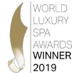
World Luxury Spa Awards 2019 – Best Luxury Spa Retreat in Greece