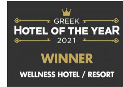
Greek Hotel of the Year Awards 2021– Wellness Hotel / Resort of the Year