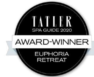
Tatler Spa Guide 2020 – Breezy Does It Award