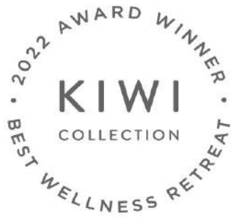
Best Wellness Retreat – 2022 Award KIWI COLLECTION