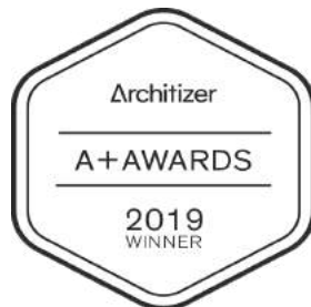
Architizer A+A Awards 2019- Popular Choice Spa Design