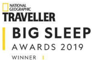
Big Sleep Awards 2019 – National Geographic Traveller