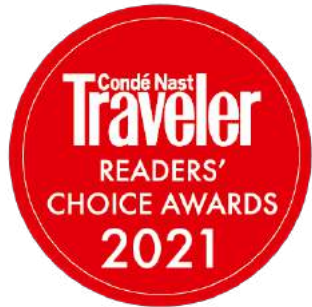
Condé Nast Traveler Readers' Choice Awards 2021 - Top 30 Destination Spa Resorts in the World